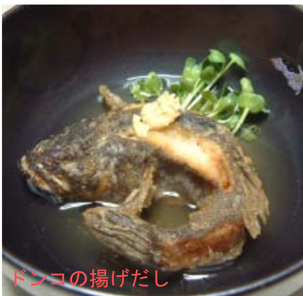
ドンコの揚げだし