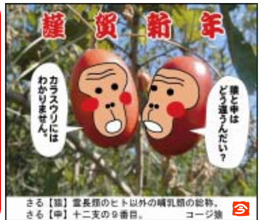
さる【猿】 霊長類のヒト以外の哺乳類の総称。さる【申】 十二支の9番目。 コージ製

•Ÿ•g•r,ÉŠÄ«•E•ŋ•,É,ç,É,Á,ç,Ä"Ŋ,S%ñ•A <GŠŠ,Æ,μ,Ä"-s,μ,Ä,ç,Ū,•B ,²•ÓŒ©•ÆŠ'z•A ,Ū,½ŠÄ«•â•ŋ•,ÉŠŌ,éŽç-â"TM•A,"'Ò,ç,μ,Ä,"è,Ū,•BŽŸ%ñ,uol.10 ,í 2004 "N 4 CEŽ•ã•ŋ"-s-ŵ'è,Á,•B •i•Ò•WŽ°•ê"•j