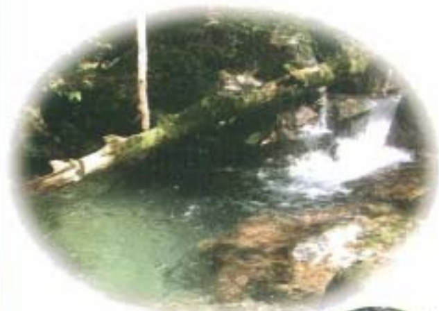
白髪岳を流れる川内川

この季節は、そういった川のいろいろな姿を見ることが出来ます。川に触れ、川を知る。そして川から自然を学ぶ、自然と共生していく第一歩ではないでしょうか。 (樋口 政信)