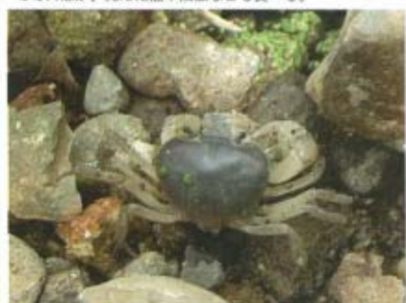
青白色タイプのサワガニ