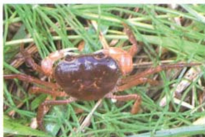
サワガニ：このような赤色タイプは主に北薩地方で見られる。甲長約25mm、清流や沢などに生息し、夜行性。雑食性で藻類、水生昆虫、ミミズほか、死んだ魚や残飯なども食べる。

指標生物とは？『環境をはかるものさし』となる生物のことです。川の指標生物は、「きれいな水」、「少しきたない水」、「きたない水」、「大変きたない水」の4段階に分けられます。