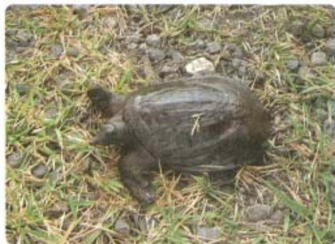
スッポン：甲羅の長さ約30cm。淡水性で、底が砂泥質の河川や、湖沼に生息します。産卵は5～8月頃で、ピンポン玉のような卵を産みます。肉食性で魚や甲殻類、昆虫、貝などを食べます。

スッポンは、一生のほとんどを「湖沼ピオトープ」または「河川ピオトープ」で過ごします。普段は水中にひそんでいますが、天気のよい日は陸でも見かけるように、頻りに日光浴を行います。さらに中洲や岸の「砂地ピオトープ（砂礫や泥でも可）」に産卵するため、これらを自由に移動できる環境が必要です。