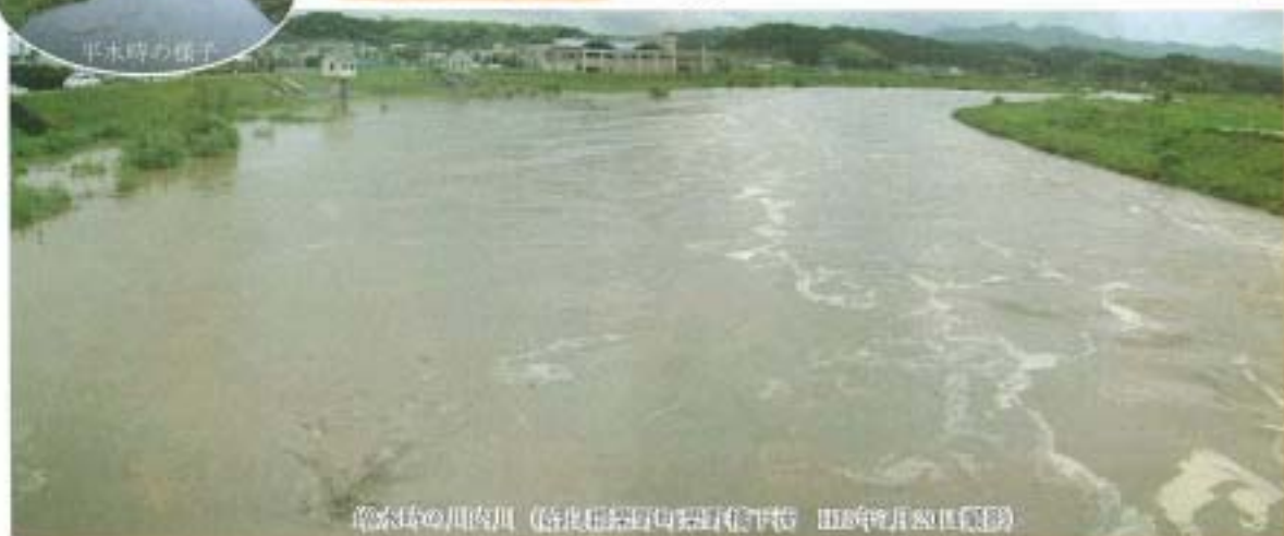
荒水時の川内川 (谷本村お宿の展望台から) 撮影年月80年6月