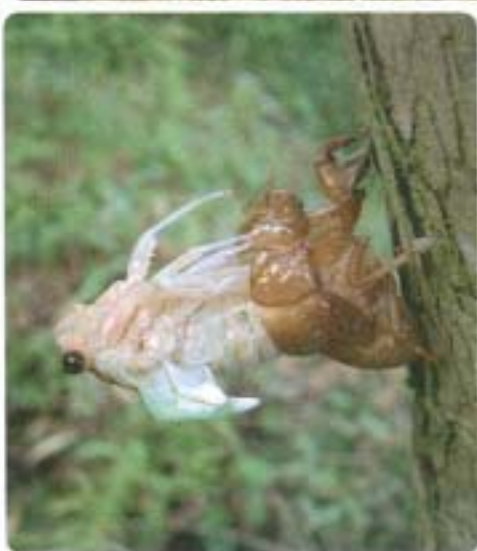
セミの羽化は夜から明け方にかけて行われる

日本に住んでいる人でセミを知らない人はいないでしょう。カブトムシやクワガタムシを見たことがない人でも、暑い夏の日セミの鳴き声を聞かされて、うんざりした(?)経験はあると思います。